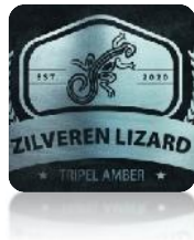
Zilveren Lizards – Tripel Amber

Product Een amberkleurige tripel, een gewaagde combinatie! Door het gebruik van Munichmout krijgt deze tripel een mooie diepe amberkleur. Complex bier met een bittere toets en een stevige, lange en ietwat zoete afdronk.