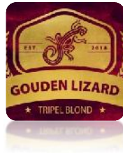
Gouden Lizards – Tripel Blond

Product Deze blondkleurige tripel is één van de paradepaardjes van de Craywinckelhof brouwerij. Met zijn zacht-zoete alcoholsmak en complexe hoppige nasmaak is Lizards Tripel Blond, een Hagelandse tripel om fier op te zijn. Een streekbier zoals geen ander.