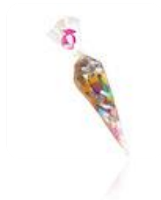
Snoep Zak Mix (250gr)